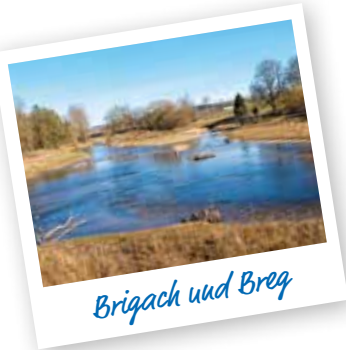
Brigach und Breg

Immer schon war die Donau ein bedeutender Handelsweg und eine politische und wirtschaftliche Verbindungslinie von Mitteleuropa bis auf den Balkan. Heute ist sie auch eine wichtige touristische Route, nicht nur über den äußerst beliebten Donauradweg.